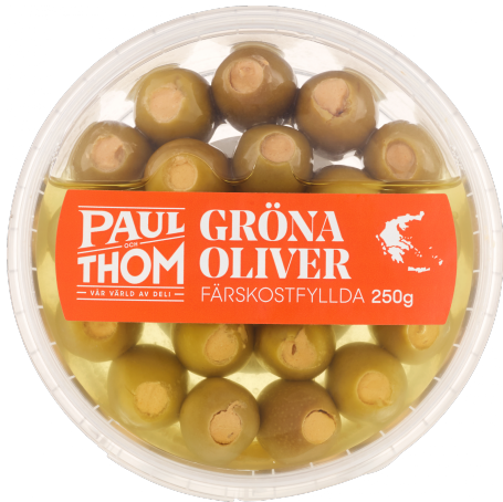
Färskostfyllda gröna oliver